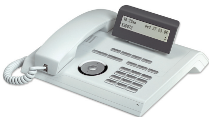
OpenStage 20 T