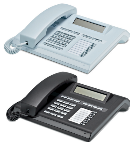
OpenStage 15 T