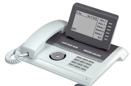
OpenStage 40 T