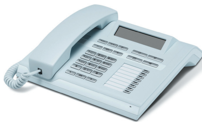
OpenStage 30 T