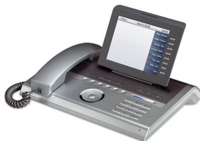
OpenStage 80 T