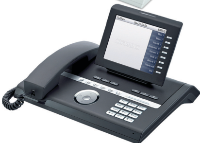
OpenStage 60 T