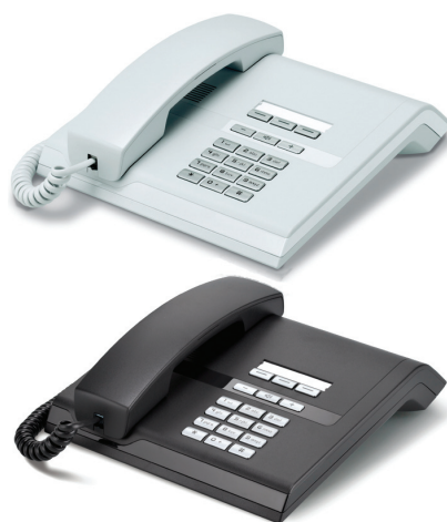
OpenStage 10 T